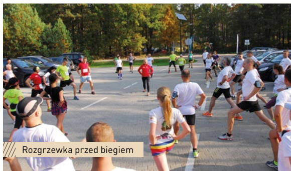
Rozgrzewka przed biegiem

Najlepsi biegacze uhonorowani zostali okolicznościowymi statuetkami, a wszyscy uczestnicy otrzymali pamiątkowe medale i wylosowali nagrody.