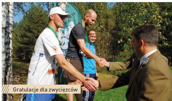
Gratulacje dla zwycięzców