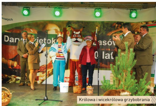
Królowa i wicekrólowa grzybobrania