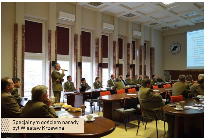
Specjalnym gościem narady był Wiesław Krzewina

25 listopada w RDLP miała miejsce narada z udziałem Wiesława Krzewiny – zastępcy dyrektora generalnego Lasów Państwowych ds. strategii, organizacji i rozwoju. Poznaliśmy bliżej Strategię PGL LP na lata 2014-2030, wyzwania stojące przed leśnikami, projekty i pomysły na przyszłość LP.