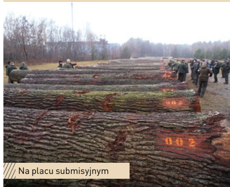
Na placu submisyjnym

21 listopada 2014 r. ponad trzydziestoosobowa grupa leśników z terenu naszej dyrekcji odwiedziła Nadleśnictwo Krasnystaw. To tutaj, na składnicy nieopodal siedziby jednostki, miejscowi leśnicy zgromadzili surowiec oferowany w V Submisji Drewna Cennego „Lubelska Jesień 2014”.