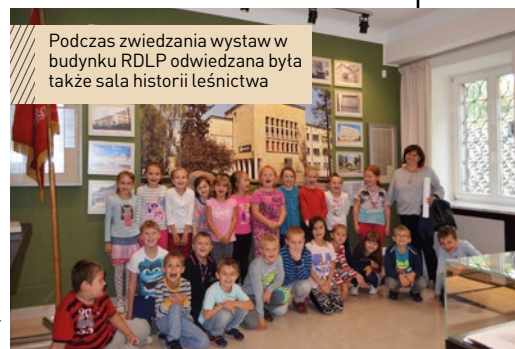
Podczas zwiedzania wystaw w budynku RDLP odwiedzana była także sala historii leśnictwa