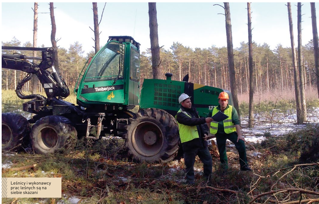
Leśnicy i wykonawcy prac leśnych są na siebie skazani