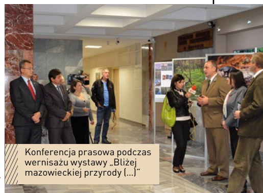
Konferencja prasowa podczas wernisazu wystawy „Blżej mazowieckiej przyrody [...]”

Podczas wszystkich wydarzeń udostępniana do zwiedzania była sala historii leśnictwa radomsko-kieleckiego. Organizowanie czasowych wystaw w zabytkowym budynku RDLP stwarza możliwość propagowania nie tylko ich treści, ale i zagadnień związanych z leśnictwem i gospodarką leśną. Tego typu przedsięwzięcia z powodzeniem organizo-