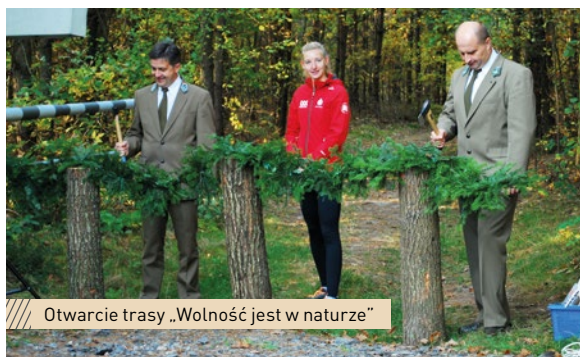
Otwarcie trasy „Wolność jest w naturze”